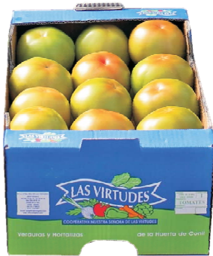
7.3 Caja de Cartón (2 Mantos). Medidas: 50X30X17 Peso Aprox: 11 Kg.